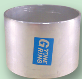
↑ Ring YONE Bentuk Awal