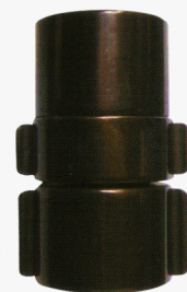
Expansion Ring Coupling, NH Threads Material : Anodized Alumunium