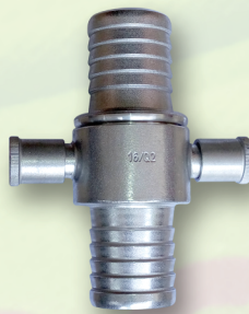
Coupling British Instantaneous Material : Alumunium Alloy