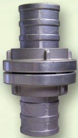
Coupling Storz Material : Alumunium Alloy