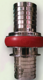
Coupling Machino "AP" Material : Chrome-Plated Brass