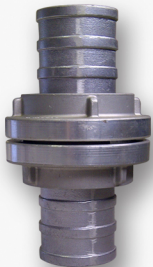
Coupling Storz Material : Alumunium Alloy