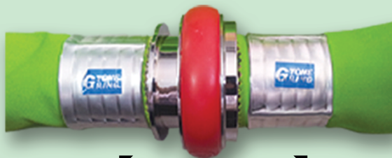
↙ ↘ Ring YONE Bentuk sesudah dipress